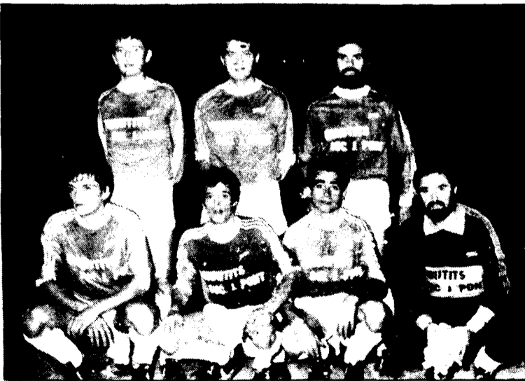
Cirilils, campions sèniors

Per acabar l'acte, els representants dels equips guanyadors donaren la tradicional volta a la pista i així acabà el torneig de futbol-sala més important de tota la rodalia d'enguany. Montserrat Graugés